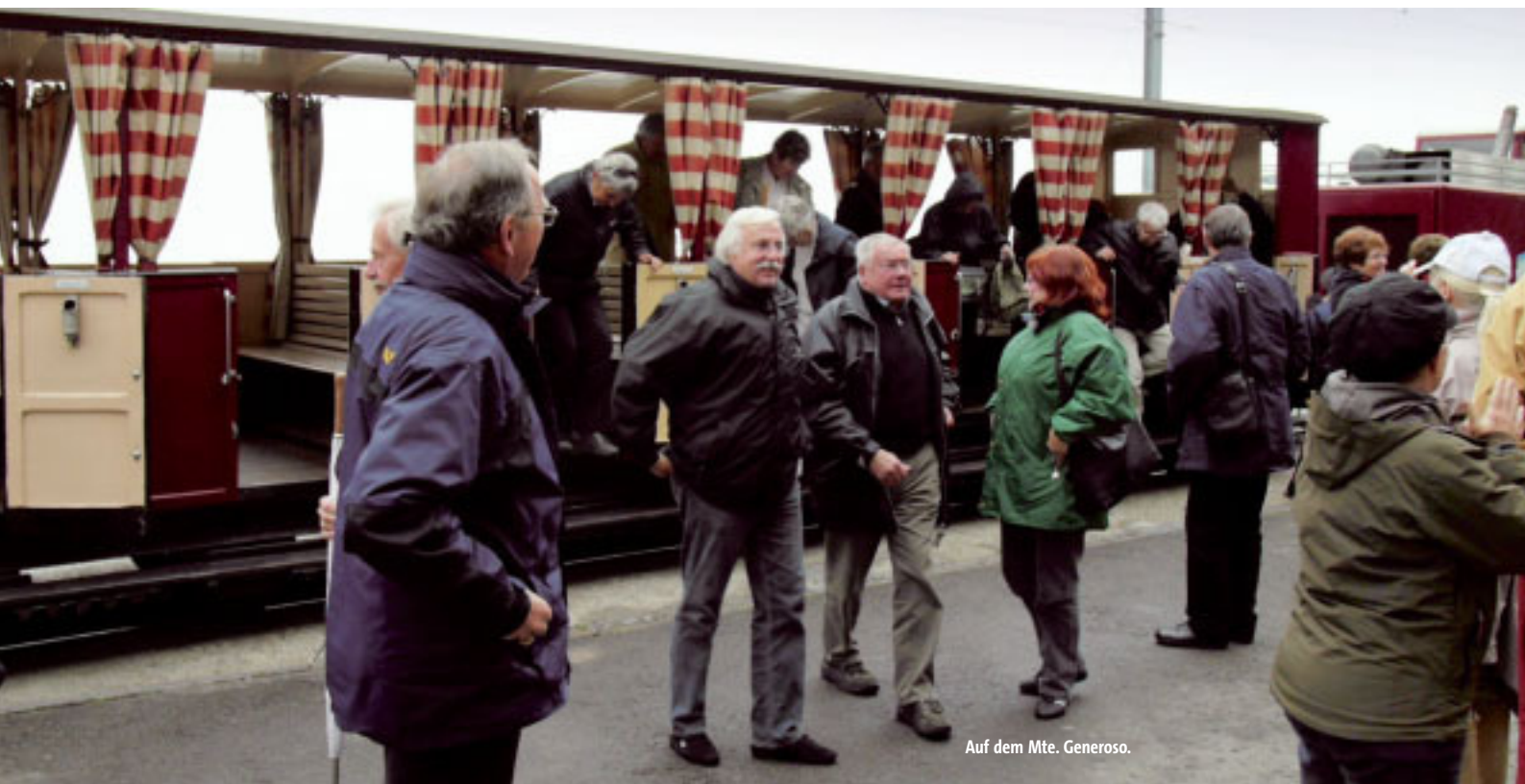
Auf dem Mte. Generoso.