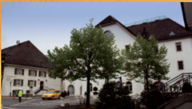
Treffpunkt Parkplatz Hotel: Kreuz-Rössli-Kornhaus, Balsthal