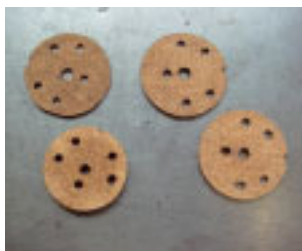
Weitere Versuche mit Korkdichtungen. Resultat: unbefriedigend.