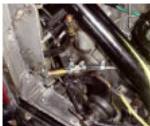
Das elektrische Ventil.