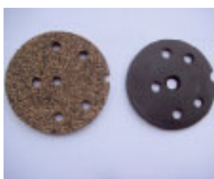
Links: die „richtige“ Dichtung vom Spezialisten aus UK. Rechts die Gummidichtung. Erste war aber auch nicht OK, sondern ein Gummi-Kork Gemisch, das quoll.