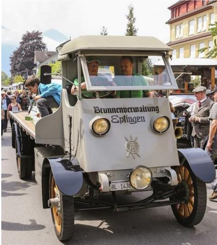
1918 Tribelhorn Elektro LKW

Alternative Antriebe waren schon immer ein Thema am O-iO.ch und sind es auch 2022.