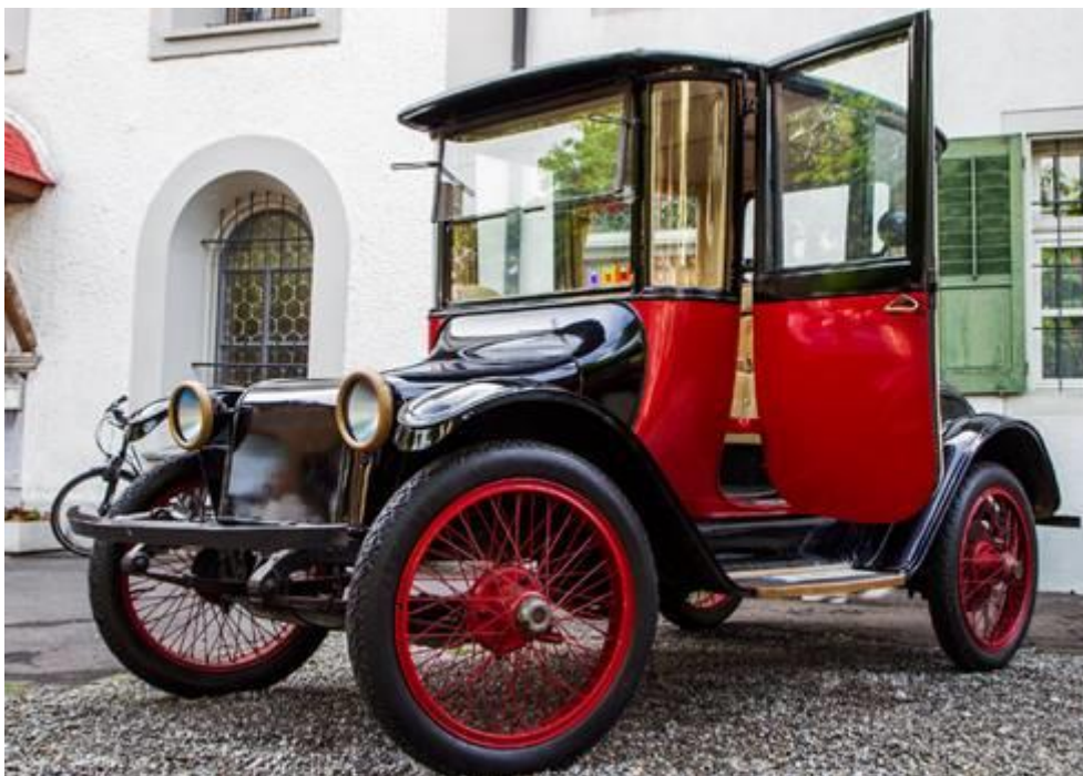
1918 Detroit Electric II