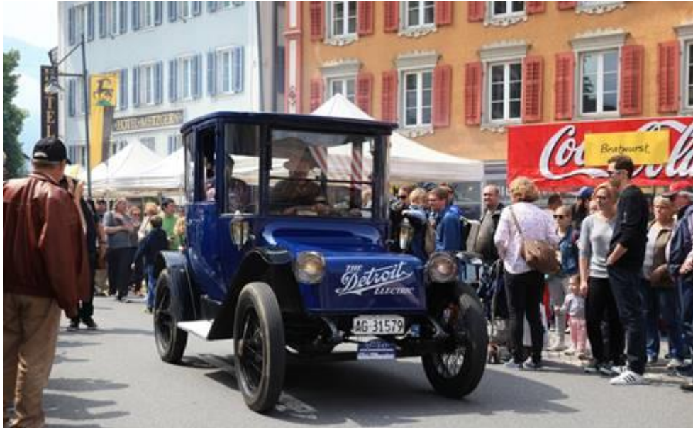
1918 Detroit Electric I

Alternative Antriebe waren schon immer ein Thema am O-iO.ch und sind es auch 2022.