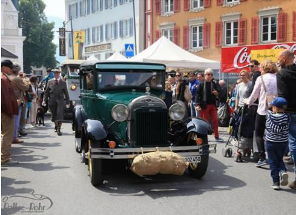
1928 Ford A mit Holzvergaser

Alternative Antriebe waren schon immer ein Thema am O-iO.ch und sind es auch 2022.