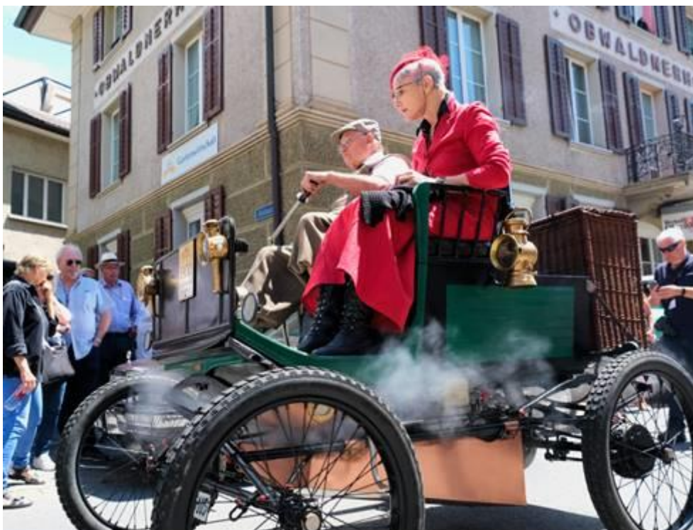
1900 Locomobile Dampfauto