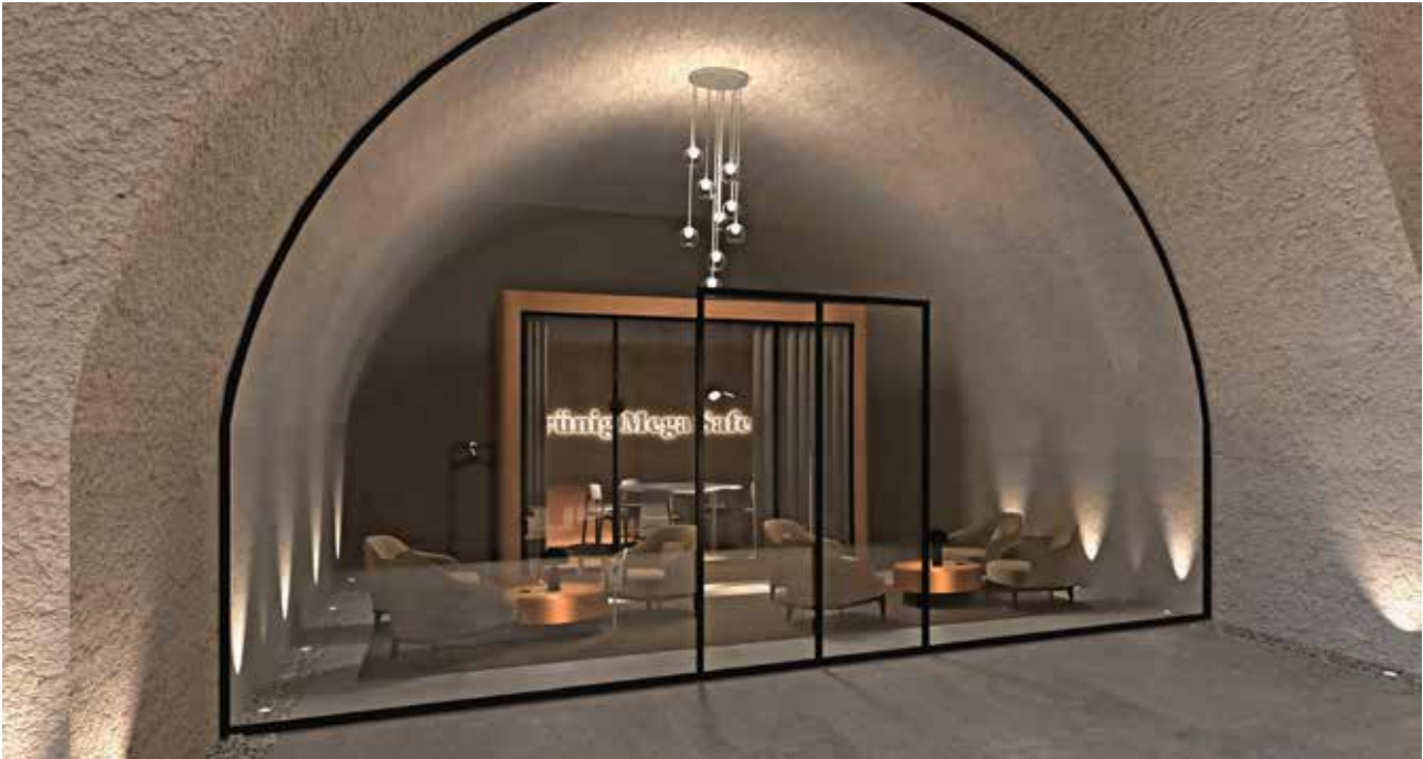
Nach einer zweifachen Sicherheitsschleuse haben Sie Zugang zur Lounge und zu Ihrer persönlichen Räumlichkeit – rund um die Uhr.