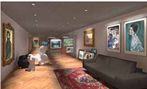
In den Safe-Räumen werden Anforderungen an die Lagerung von Kunst und Gemälden optimal erfüllt.