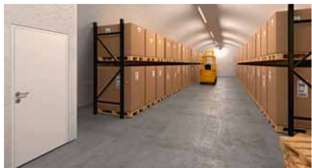
Im Bereich der sicheren Lagerlogistik ist die Brüning Mega Safe AG der professionelle Partner.