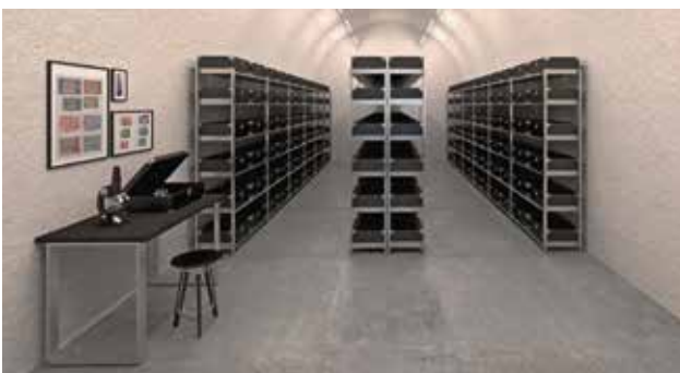
Sichere Aufbewahrung von Wertgegenständen und Daten.