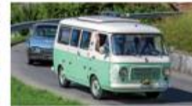
O-iO heisst auch tolle Ausfahrten mit viel Publikum unterwegs.