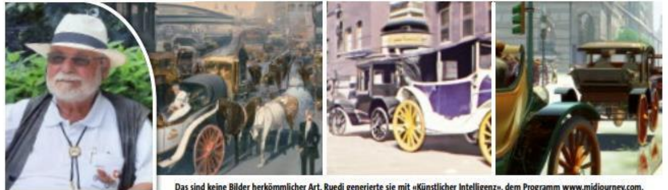
Das sind keine Bilder herkömmlicher Art. Ruedi generierte sie mit «Künstlicher Intelligenz», dem Programm www.midjourney.com .

Offizielles Organ des Schweizer Motor-Veteranen-Clubs, gegründet 1957, FIVA-Mitglied