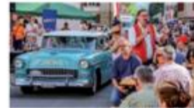
O-iO.ch ist ein fröhliches Volksfest der guten Laune.

eröffnet den Reigen von drei SMVC Publikums-Anlässen, siehe auch Seiten III (Seleger Moor) und IV (Laufen). Alle versprechen Spass und Vergnügen. Aber, sie erfüllen auch eine Aufgabe, nämlich unsere Leidenschaft der Allgemeinheit zu präsentieren. Wir brauchen die Bevölkerung auf unserer Seite, je länger je mehr.