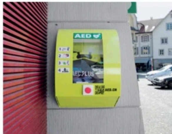
Defibrillator-Gerät beim Spritzenhaus

Wilerstrasse 35, Wilen (2. Stock Haupthaus)