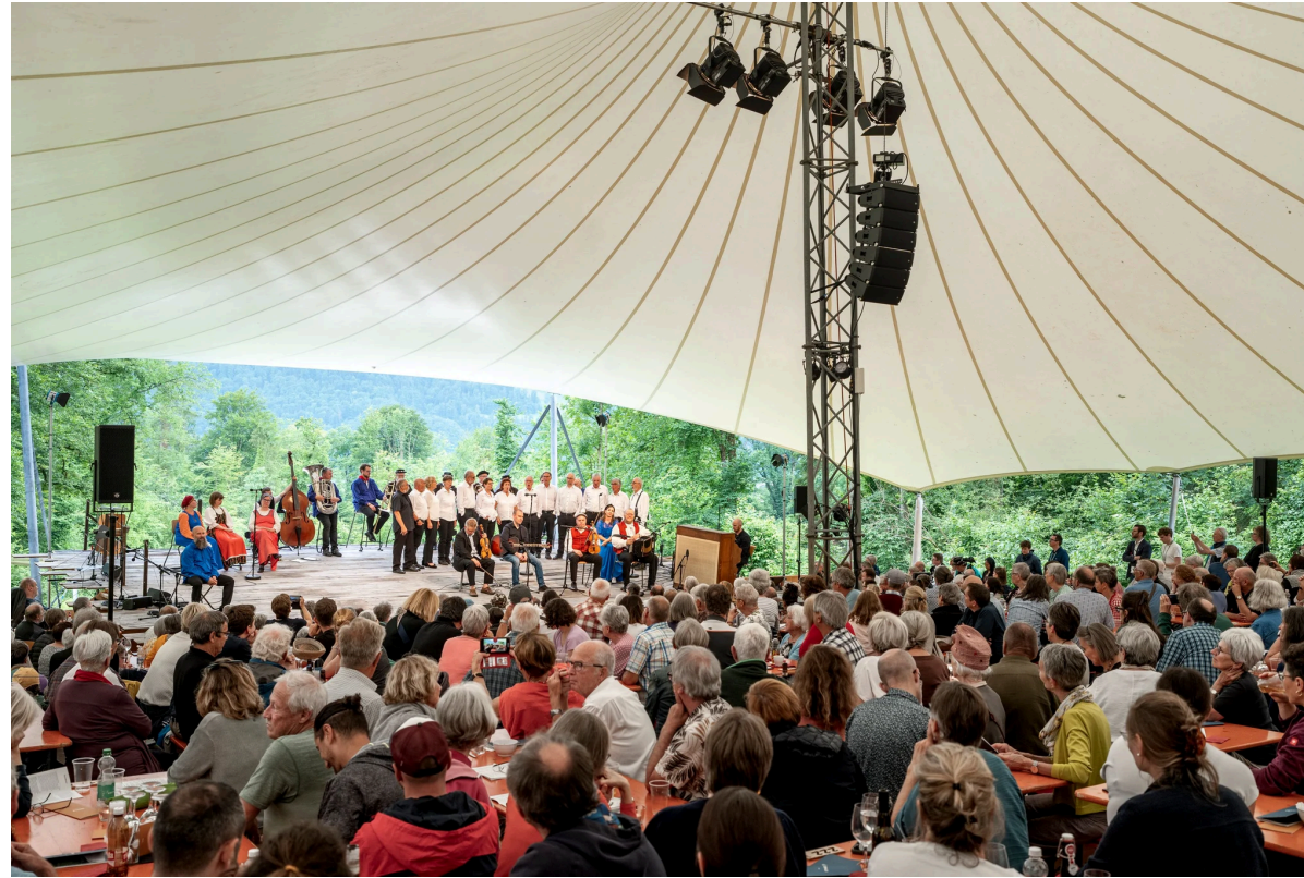
Blick auf die Bühne des Obwald in der Lichtung Gsang in Giswil.

Bild: Christoph Riebli/Obwald/zvg (Giswil, 30. 6. 2024)