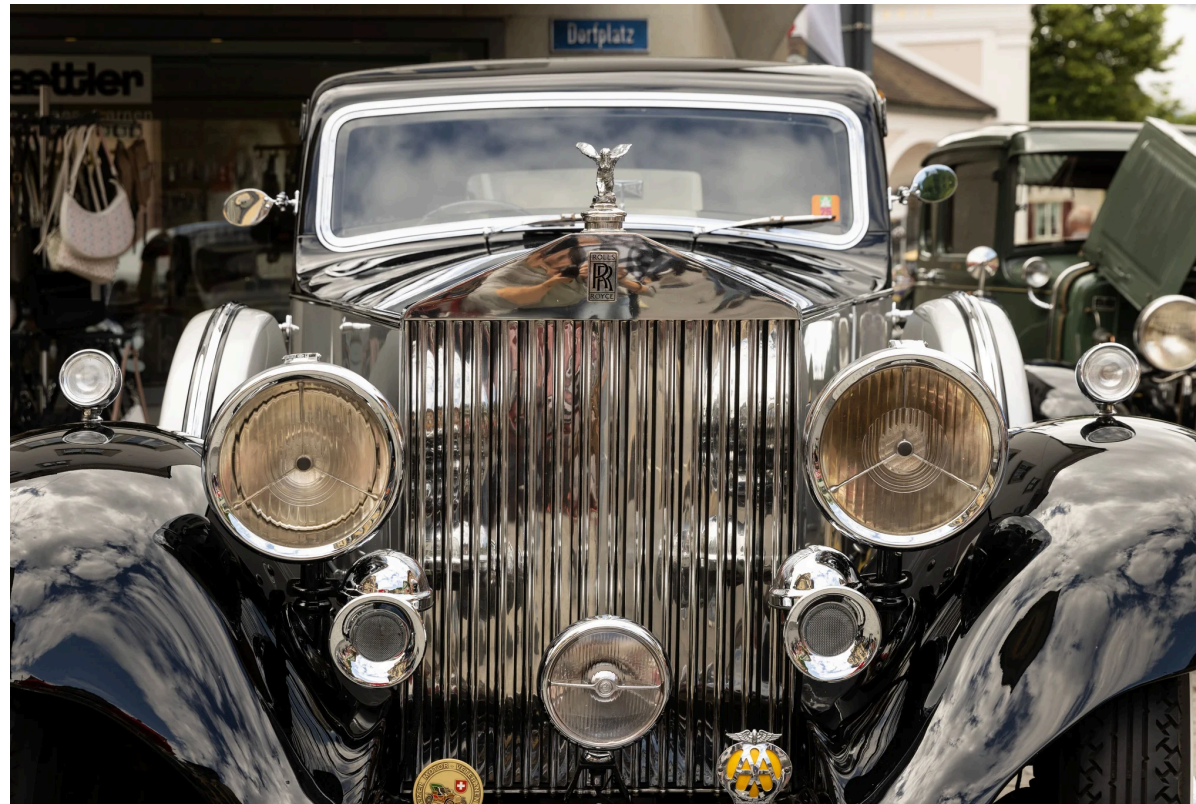
Impression vom O-iO Oldtimer in Obwalden im vergangenen Jahr.