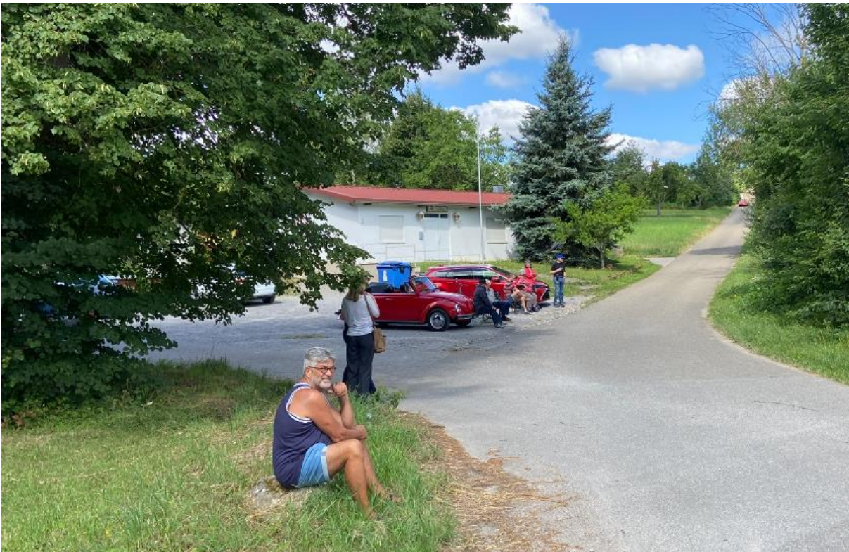
Bild 2: Zuschauer am Strassenrand an vielen Stellen. Hier nicht das Bild mit den «Frühstückern»,